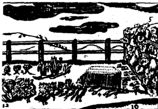
3. ábra Az Orbis pictus XVI. számú képe (Az első londoni kiadásban)