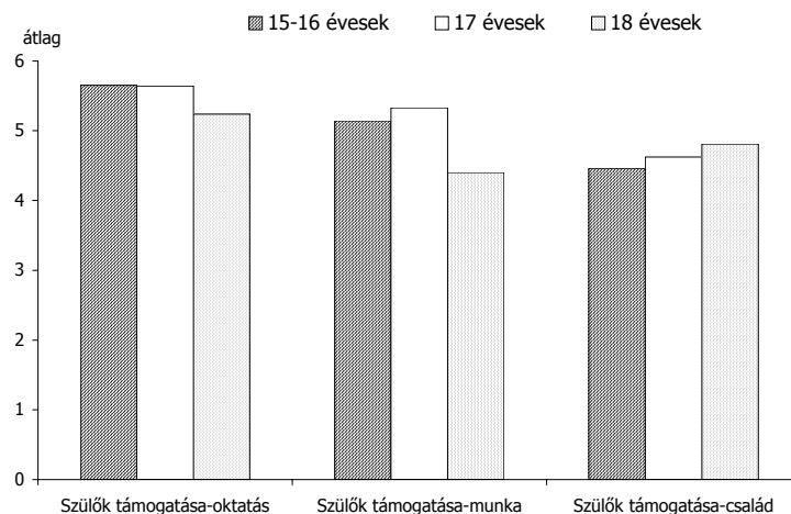
3. ábra Szignifikáns különbségek a szülői támogatás megítélésében

Három esetben még szignifikáns különbséget találtunk abban, hogy az oktatással (F=4,73; p<0,01), jövőbeli munkahelyükkel (F=6,35; p<0,01), és családi életükkel (F=9,54; p<0,01) kapcsolatos céljaikat a szülők mennyire támogatják. A továbbtanulással kapcsolatos célok tekintetében a 15–17 évesek közel azonos mértékű támogatásról számoltak be (átlag 1 =5,65; szórás 1 =0,74; átlag 2 =5,64; szórás 2 =0,83), különbözve a 18 évesek csoportjától (átlag 3 =5,24; szórás 3 =1,21). A jövőbeli munkahelyükkel kapcsolatos reményeik támogatása szempontjából a 17 évesek számoltak be legmagasabb szintű szülői támogatásról (átlag 2 =5,33; szórás 2 =1,02), őket követték a 15–16 évesek (átlag 1 =5,14; szórás 1 =1,16) és érdekes módon a 18 évesek csoportja észlelte a legalacsonyabb szintű szülői támogatást (átlag 3 =4,40; szórás 3 =1,69). A családi élettel kapcsolatban pedig a 18 évesek számoltak be legmagasabb szintű (átlag 3 =4,81; szórás 3 =3,13) szülői támogatásról, majd őket követte a 17 évesek csoportja (átlag 2 =4,62; szórás 2 =1,89), és a 15–16 évesek csoportja (átlag 1 =4,46; szórás 1 =1,77) (lásd 3. ábra).