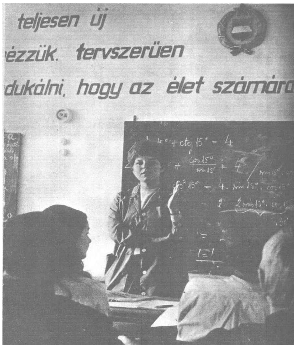
3. kép. Az állam képviselője

Csákó Mihály (2003. 471. o.) egyik kritikájában Heidegger azon megállapítását idézi, mely szerint a technológia (és így az oktatástechnológia is) „nem semleges eszköz egy kívánt célhoz, hanem a dolgok megközelítésének egy módja”. A racionalitás, a hatékonyság növelésének elve az oktatásban valójában ideológiai tartalmakat is hordoz, s nemcsak eszköz- és emberi erőforrás kérdése. A gondolkodásmódok, a társadalmi be-