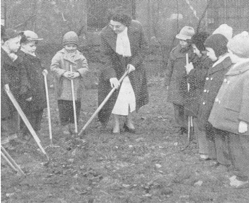
Megkezdődött a kerti munka

1. kép. A nevelő